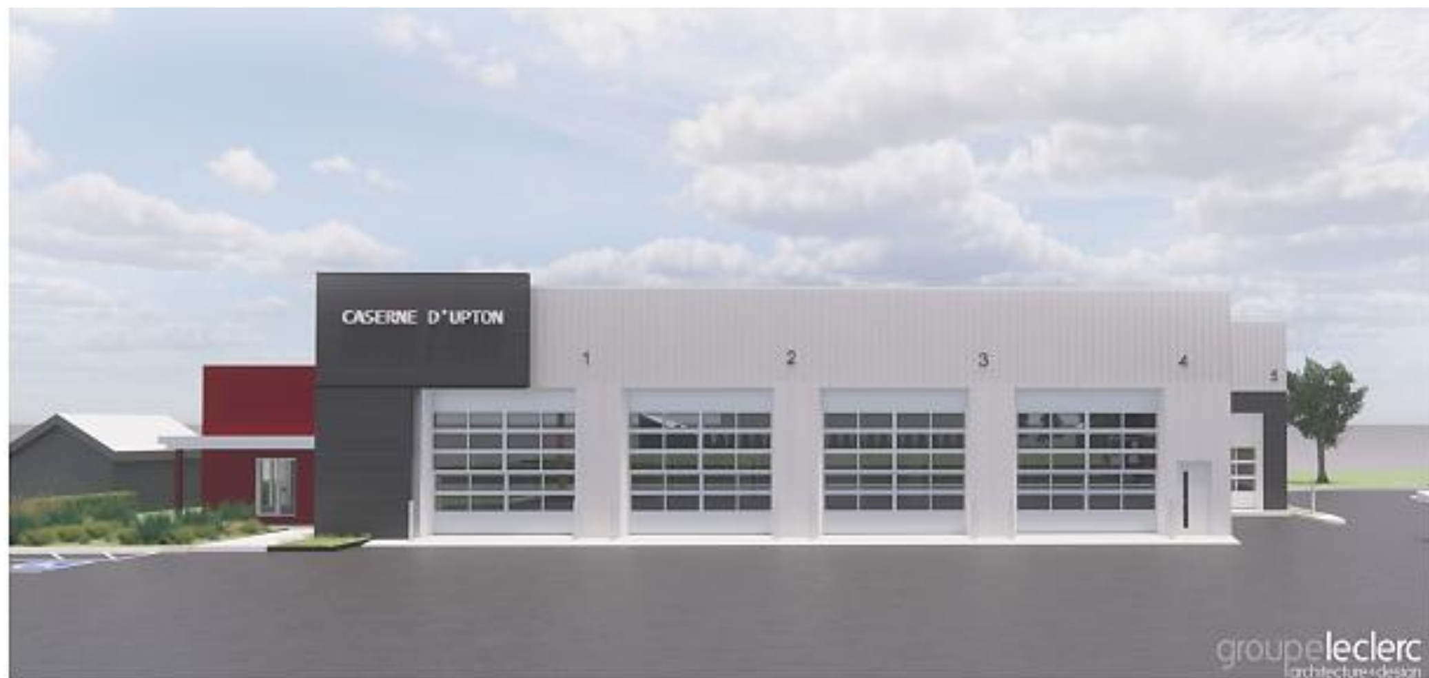
PERSPECTIVE AVANT IMAGE À TITRE INDICATIF SEULEMENT